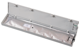
Paquetes de tinta desgasificados