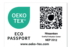
Certificación ECO PASSPORT