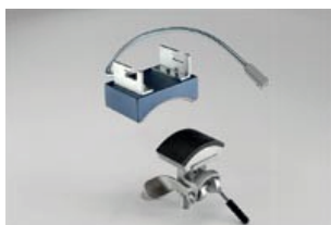
Accesorio de gorra compuesto por una base inferior y una superior